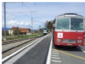
Gare LEB, Bercher